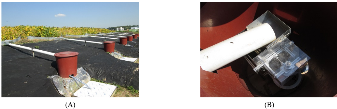
Fig. 2. Device for soil loss measurement during soybean cultivation (A), the machine used for partial collection of run-off water in plastic buckets (B).

cm의 1열 이랑(이랑높이 20 cm)을 작성하면서 주간 15 cm 간격으로 파종하였다(Fig. 1A). 콩 파종기는 2013년은 5월 23일 2014년도는 5월 26일 이었다. 제초제 처리구는 콩 파종 후 3일에 토양처리제초제를 사용하였는데 콩과 보리에 동시에 약해가 없는 에탈플루랄린(상표명 쏘나란)과 리뉴론(상표명 아파론) 액제를 혼용하여 살포하였다.