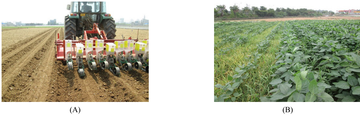
Fig. 1. Mechanized planting of soybean at the same time as ridge formation (A), difference in soybean growth ; left: barley living mulch, right: no mulch (B).